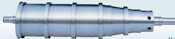
JUMBO 3 HS