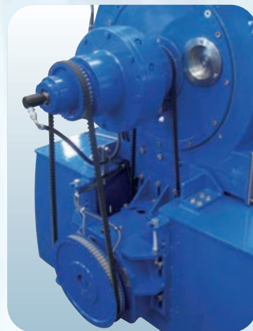
Particolare Rotovariatore e riduttore Detail of Rotovariator and reduction gear