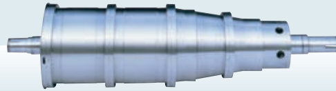
JUMBO 2 HS