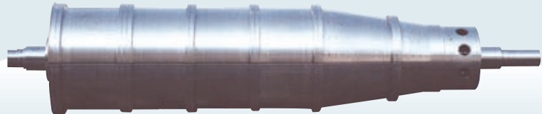
GIANT 3 HS