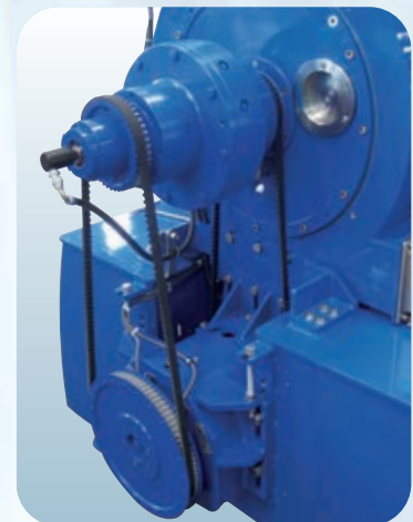
Particolare Rotovariatore e riduttore Detail of Rotovariator and reduction gear