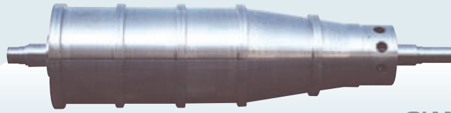
GIANT 2 HS